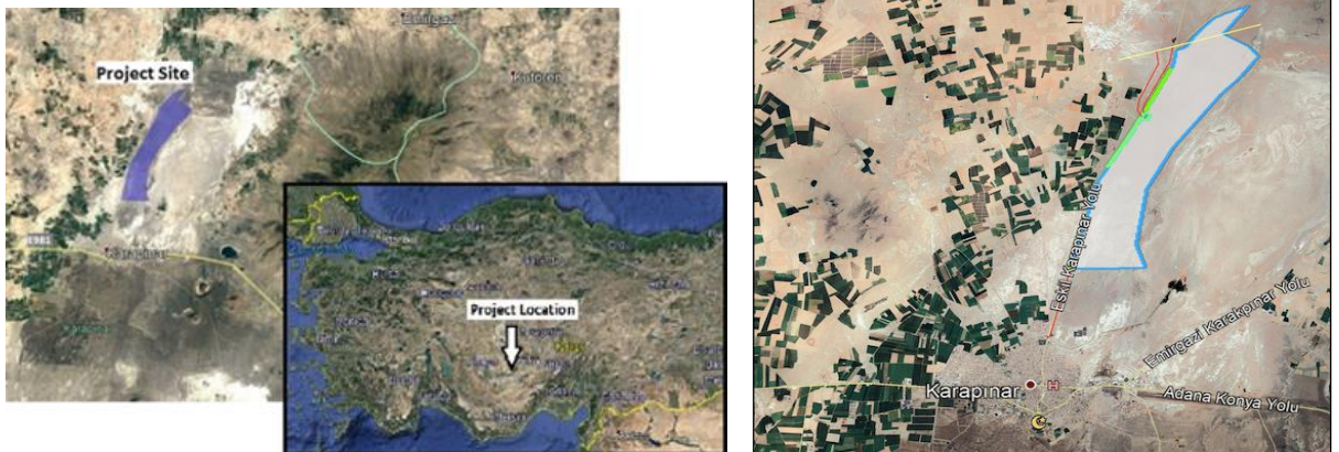
Şekil 1-1 Proje sahasının yeri

Proje alanı, Konya iline bağlı Karapınar ilçesinde yer almaktadır. Faaliyet sahasına en yakın yerleşim yeri, 1,5 km mesafede yer alan Karapınar ilçe merkezi olup yaklaşık 8,3 km mesafede Kayalı ve 12 km mesafede Yeşilyurt yer almaktadır. Ayrıca proje sahasına yakın ve yalnızca hayvancılık faaliyetleri için kullanılan (daimi ikamet edilmeyen) yayla evleri de bulunmaktadır. Büyükkarakuyu, Küçükkarakuyu, Kirkitoğlu, Ekmekçi ve Seyithacı yaylalarında yaklaşık 60 yayla evi bulunmaktadır. Son olarak Kasım 2020'de yapılan saha araştırmasında bu yaylalardaki 60 haneden yalnızca 3 hanenin yaylada 12 ay kaldığı öğrenilmiştir. Diğer yayla evleri yaz aylarında hayvancılık faaliyetleri sırasında geçici barınma amaçlı kullanılmaktadır. Faaliyet alanı ulaşım açısından rahat bir konumda yer almaktadır. En yakın güzergah, Konya-Adana karayoludur. Bölgede ulaşımı kolaylaştırmak amacıyla yan yollarda iyileştirme çalışmaları yapılmıştır.