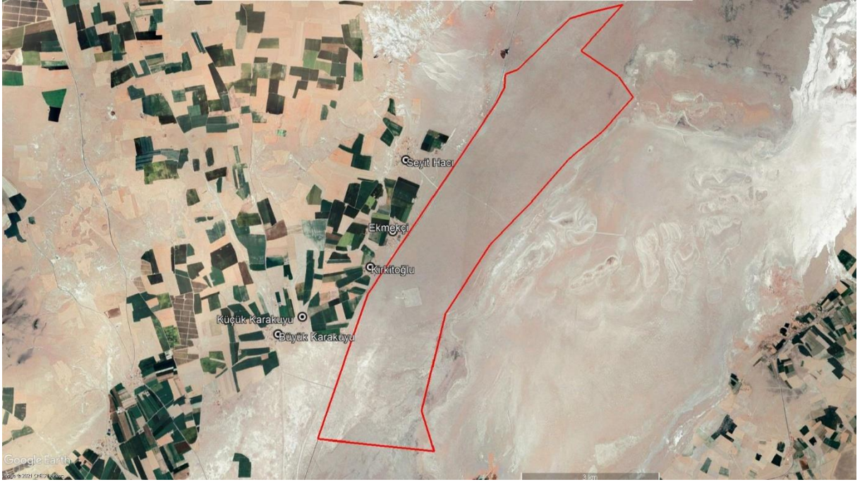
Şekil 1-2 Proje den etkilenen yayla evleri